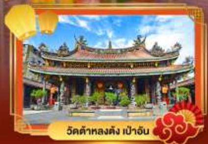
วัดต้าหลงตง เป่าอัน