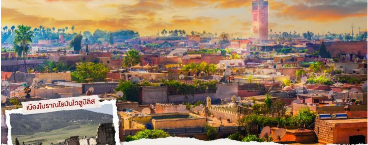
เมืองโบราณโรบินโซลูบิลิส