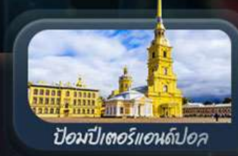
ป้อมปีเตอร์แอนด์ปอล