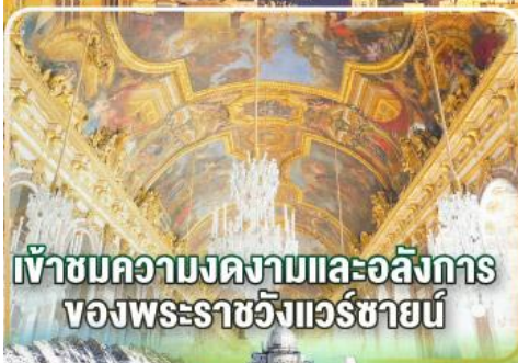
เข้าชมความงดงามและอลังการ ของพระราชวังแวร์ซายน์