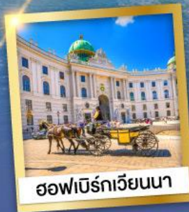
ออฟเบิร์กเวียนนา

เข้าชมความงดงามภายใน ของปราสาทนอยชวานสไตน์