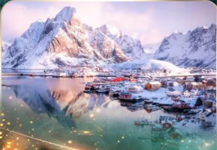
หมู่บ้านเรนเน