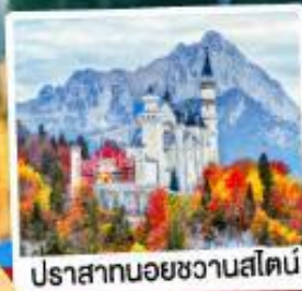
ปราสาทน้อยชวานส์ไตน์