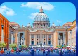
นครรัฐวาติกัน โรม