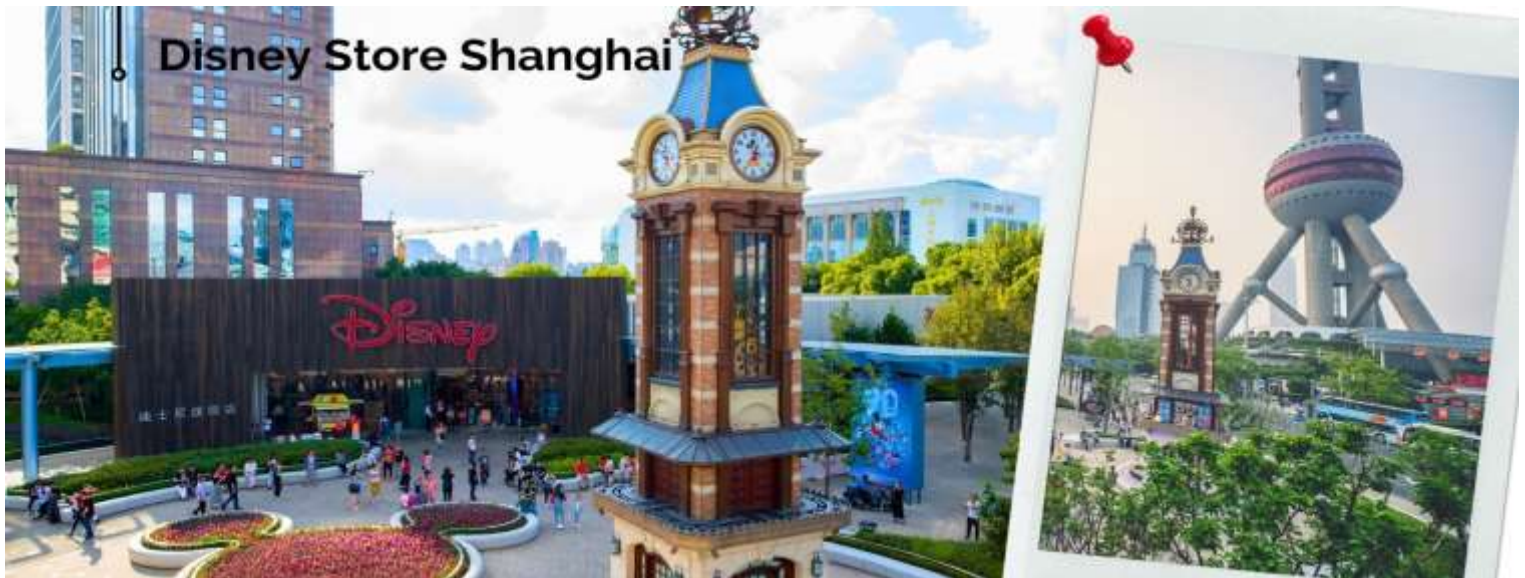
Disney Store Shanghai

นำท่านเดินทางกลับสู่มหานครเซี่ยงไฮ้ โดยใช้เวลาเดินทางประมาณ 2 ชั่วโมง จากนั้นนำท่านแวะชมความอลังการของ Disney Store Shanghai สาขาที่ใหญ่ที่สุดในโลก ให้เหล่าสาวก Disney ที่เพลิตเพลิน และเลือกซื้อสินค้าทุกคาแรกเตอร์ของ Disney จากนั้น ผ่านชมหอไข่มุก เป็นหอส่งสัญญาณวิทยุโทรทัศน์สูง 468 เมตร ลักษณะเป็นไข่มุก 11 ลูก และ เสา 3 เสา ด้านบนเป็นรูปไข่มุก 3 เม็ด 3 ขนาดเรียงกันในแนวตั้ง เมื่อชมวิว ถ่ายรูปกันจนหน้าใจแล้ว