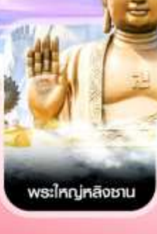
พระใหญ่หลังเขา