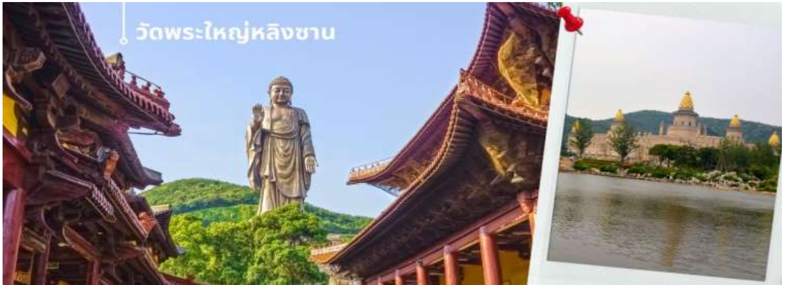
วัดพระใหญ่หลิงชาน

พักที่ (เมืองอู๋ซี) Holiday Inn Express Wuxi Hotel หรือเทียบเท่า ระดับ 4 ดาว