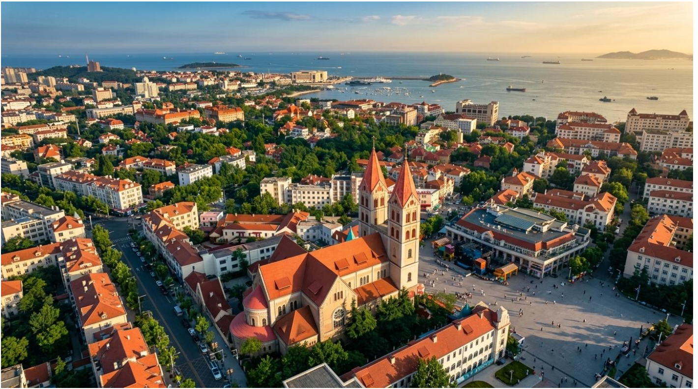
ป้าย นำท่านเดินทางกลับสู่ เมืองชิงเต่า (ระยะทาง 226 ก.ม. ใช้เวลาเดินทางประมาณ 3.5 ชั่วโมง)