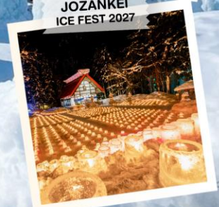
JOZANKEI ICE FEST 2027

วันเดินทาง 27 ม.ค. - 1 ก.พ. 2570 29 ม.ค. - 3 ก.พ. 2570