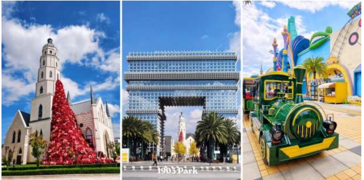
วัดหยวนทง – PARK1903 – สนามบินคุนหมิงฉางชู่ย – กรุงเทพฯสุวรรณภูมิ (อิสระอาหารกลางวัน)

จากนั้นนำท่านสู่ Park 1903 (สวน 1903) แลนด์มาร์คสุดชิค ได้กลิ่นอายยุโรปและศูนย์การค้าไลฟ์สไตล์ใจกลางเมืองคุณหมิง (มณฑลยูนนาน) ที่โดดเด่นด้วยการจำลองสถาปัตยกรรมสไตล์ยุโรป ผสมผสานศิลปะ ความบันเทิง และสวนสนุกเข้าไว้ด้วยกันอย่างลงตัว สถาปัตยกรรมจำลอง ประตูชัยปารีส อันโด่งดังโบสถ์คริสต์ (Gospel Auditorium) และพื้นที่จัดแสดงนิทรรศการPop Mart สาขาใหญ่ สำหรับสายอาร์ตทอยสวนสนุก Dream Park: สวนสนุกที่มีทั้งโซนในร่มและกลางแจ้ง (ตั๋วไม่รวมค่าเข้าสวนสนุก)เป็นแหล่งเสื้อผ้าแบรนด์เนมทั้งของจีนและต่างประเทศ เครื่องประดับอัญมณีชิ้นเยี่ยม ร้านเครื่องดื่ม ร้านอาหารพื้นเมือง