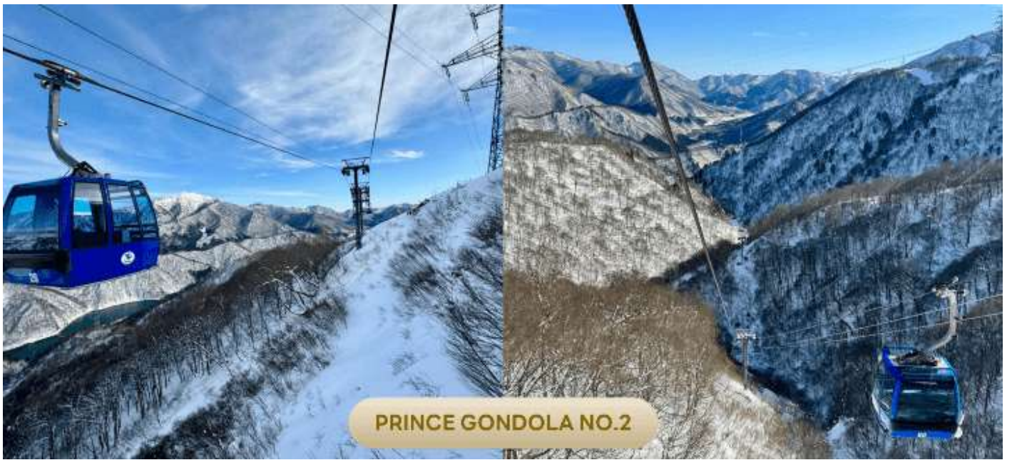
PRINCE GONDOLA NO.2