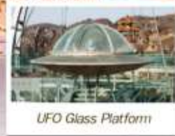
UFO Glass Platform