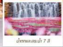
น้ำตกทะเลสาบน้ำ 7 สี