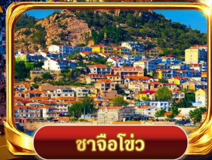
ซาจิวโซ่ว