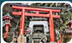
ศาลเจ้าอินะซิมะ