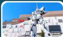
ห้างไดเวอร์ซิตี