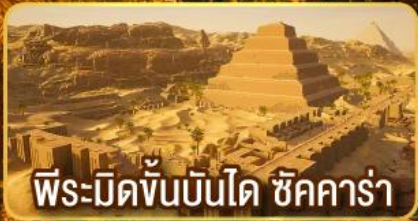
พีระมิดขั้นบันได ชิคคาร์่า