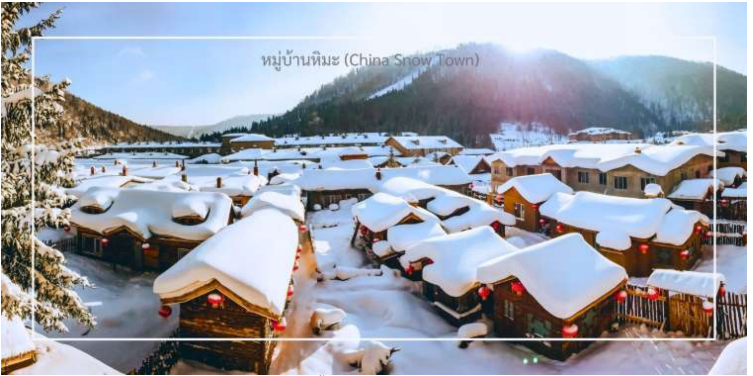
หมู่บ้านหิมะ (China Snow Town)