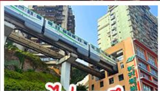
รถไฟทะลุคด