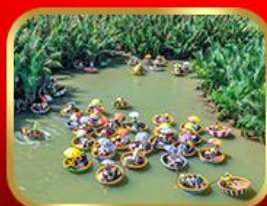
ล่องเรือกระดิ่งกั๊กทาน