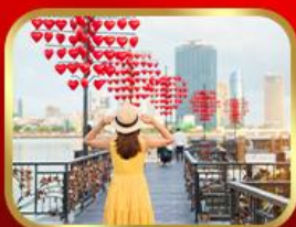
เช็กอินสะพานแห่งความรัก