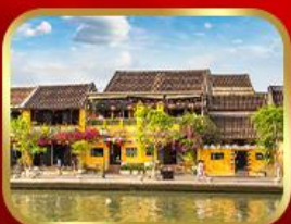
เที่ยวเมืองเก่าฮอยอัน