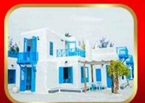
คาเฟ่ Son Tra Marina