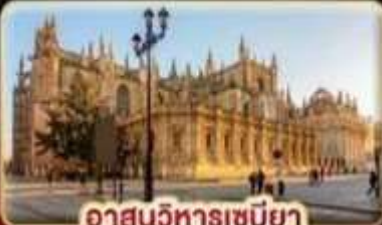
อาสนวิหารเซบิยา