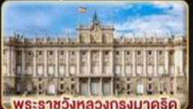
พระราชวังหลวงกรุงมาดริด