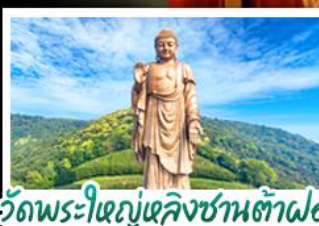
วัดพระใหญ่เฉิงชานต้าฝอ