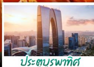
ประตูบูรพาทิศ