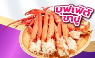
บุฟเฟ่ต์ 3 อย่าง