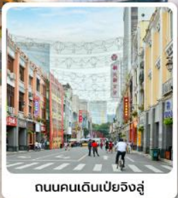
ถนนคนเดินเป่ย์จิงลู่