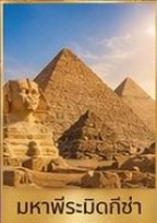
มหาพีระมิดกิซ่า