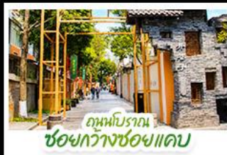
ถนนโบราณ ซอยกว้างซอยแคบ