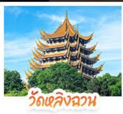
วัดเลิ่งฉวน