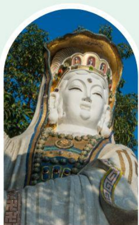
เจ้าแม่กวนอิม ธิพลสัย