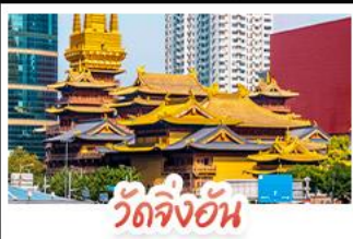
วัดจิ้งอัน

ล่องเรือสุดโรแมนติกแม่น้ำหวงผู่ จตุรัสเทียนอันเหมิน จตุรัสใหญ่ที่สุดในโลก ใจกลางประวัติศาสตร์จีน พระราชวังต้องห้าม พระราชวังโบราณสุดอลังการ มรดกโลกยูเนสโก ถนนนานกิง แหล่งช้อปปิ้งสุดฮิต แบนด์เนม ของฝากเพียง