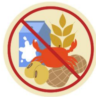
● แพ้อาหาร / อื่นๆโปรดระบุ