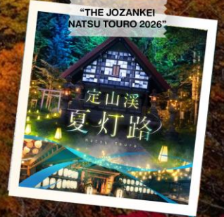
“THE JOZANKEI NATSU TOURO 2026”

วันเดินทาง 23 - 28 ต.ค. 2569 (วันปืยมหาราช) 28 ต.ค. - 2 พ.ย. 2569 30 ต.ค. - 4 พ.ย. 2569