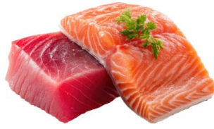
● เนื้อปลาดิบ