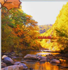
“JOZANKEI FUTAMI BRIDGE”