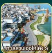
ทะเลสาบเอ๋อไห่คิง S