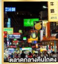
ตลาดกลางคืนโตง