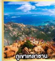
กุหาเหลาซาน