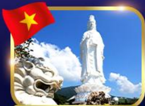
ชมพระอภิมหาอิม วัดหลินอึ้ง