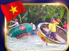
ล่องเรือกระดิว หมู่บ้านกัมบาน