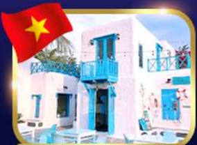
คาเฟ่สไตล์ซานโตรินี่ ชันตรา มาริน่า