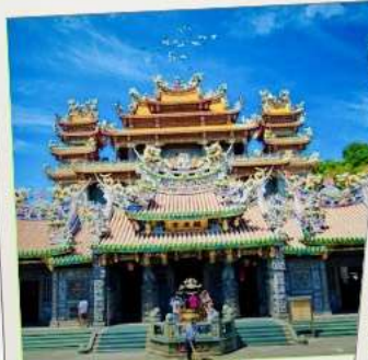
วัดกวนตู่