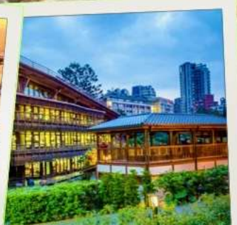
ห้องสมุดเป่ย์โถว