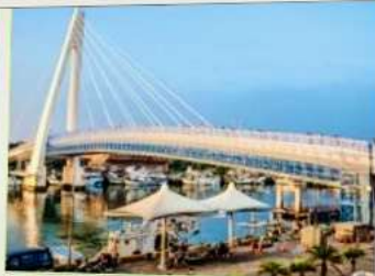
สะพานคู่รักตั้นส่วย