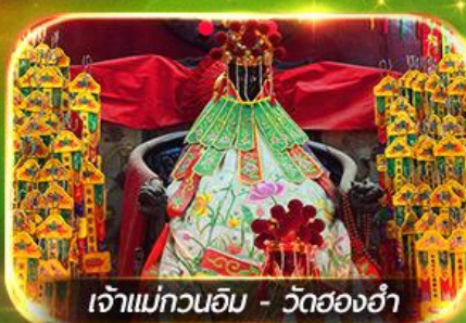
เจ้าแม่กวนอิม - วัดย่องฮำ