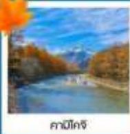
คามิโกจิ