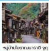
หมู่บ้านโบราณมาราชิ จุกุ