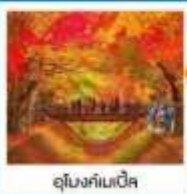
อุโมงค์เมเน็ค