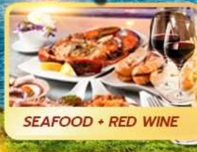
SEAFOOD + RED WINE