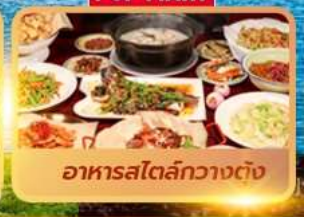
อาหารสไตล์กวางตุ้ง