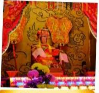
เจ้าแม่ทับทิม จอสเฮ้าส์เบย์