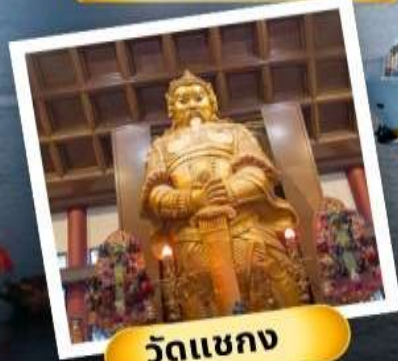
วัดเขากง