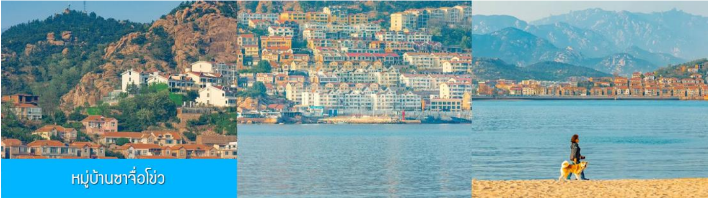
หมู่บ้านซาจื่อโข่ว

เช้า รับประทานอาหารเช้า ณ ห้องอาหารของโรงแรม (4)