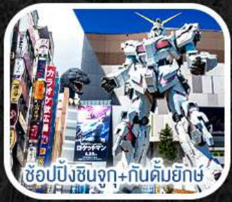
ช้อปปิ้งชินจูกุ+กันดั้มยักษ์