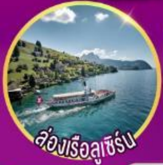
ล่องเรือลูซิิร์น