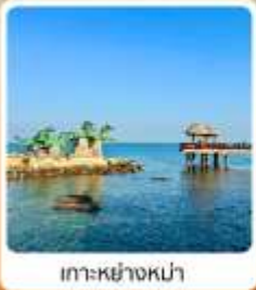
เกาะหย่างหม่า

ไฮไลท์...เที่ยวแดนมังกรฟิลยุโรป เมืองชายฝั่งทะเลเหลือง ชมสะพานจ้านเจียว และพิพิธภัณฑ์เบียร์