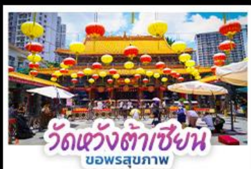
วัดแห่งต้าเซียน บอพรสุขภาพ