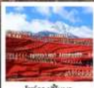
โชว์จางอีหนว

เมืองโบราณต้าหลี่ / เจดีย์สามองค์ / ไค้งร / ภูเขาสานอ้อไห่ / เมืองโบราณแซงกรีล่า / ซองเกนเสื่อกระโถด (รวมมินโตเคอนซัน-คง) / วัดสามะชงจันหลิง (รวมท่ารถขึ้น-ลง) ชมวิวยามค่ำคืนเมืองโบราณลี้เจียง / ภูเขาหิมะมิงกรหยก (มิงกรฮ่าใหญ่) / หมู่ชาพระจินกรสีน้ำเงิน ปู่ศุ่ยเหอ (รวมรถออสฟ) / โชว์จางอีหนว / เมืองโบราณไปซา นั่งรถไฟชมวิวรอบภูเขาหิมะมิงกรหยก / สระมิงกรดำ / คาเฟ่ไว้นดื่ม YUN DI AN CAFE (รวมค่าเครื่องดื่ม) / เมืองโบราณลี้เจียง / ถนนคนเดินจินปี้สุ่