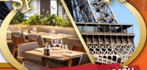
รับประทานอาหารกลางวันบนหอคอไอเฟล

ไฮไลท์ในโปรแกรม • สะพานไม้ชาเปล ลูเซิร์น