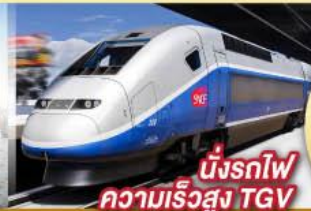
นั่งรถไฟความเร็วสูง TGV