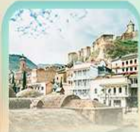
อะบาโนตูปานี