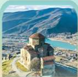
มณฑิวนารจวารี