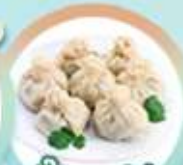
เกี้ยวจอร์เจีย Khinkali