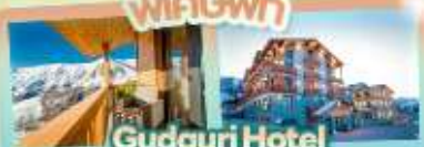
Gudauri Hotel วิวเทือกเขาคอเคซัส