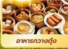
อาหารกวางตุ้ง