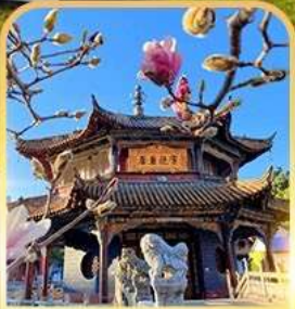
วัดหยวนทง