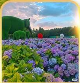
ดอกไม้ตามฤดูกาล