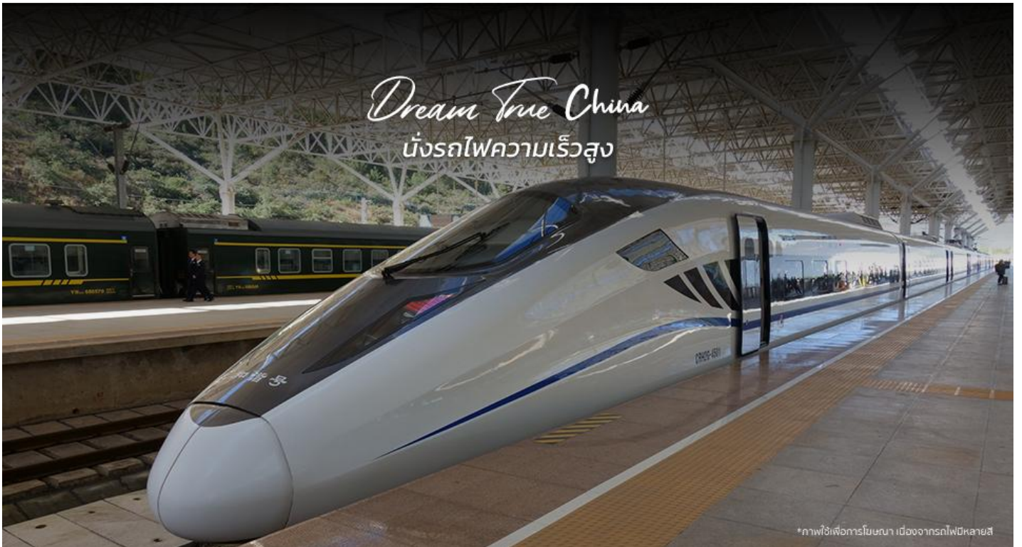
*ภาพใช้เพื่อการโฆษณา เมืองจากรถไฟหลายสี

**ขบวนรถไฟอาจมีการเปลี่ยนแปลง** หมายเหตุ: เพื่อความสะดวกในการเดินทางของท่าน ทางบริษัทฯจะนำกระเป๋าเดินทางของท่านขึ้นรถบัส โดยท่านถือเฉพาะสิ่งของสำคัญ และจำเป็นขึ้นรถไฟความเร็วสูงเท่านั้น รถบัสจะนำกระเป๋าเดินทางของท่านไปจัดเตรียมไว้ที่โรงแรม