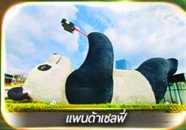
แพนด้าเซฟี่