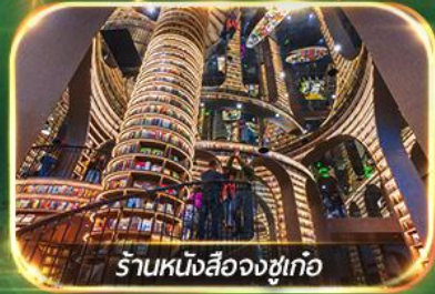
ร้านหนังสือจงซูเก้อ

เที่ยวชม 2 อุทยาน ปี้เฟิงโกว & จิวจ้ายโกว (รถเหมา)