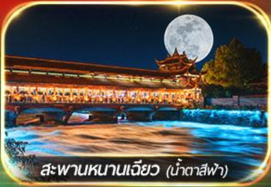
สะพานหนานเจียว (น้ำตาสีฟ้า)