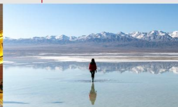
ทะเลสาบซิงไห่

*ทางบริษัทฯ ขอสงวนสิทธิ์ในการสลับโปรแกรมทัวร์ตามความเหมาะสมขึ้นอยู่กับสถานการณ์หน้างาน โดยคำนึงถึงผลประโยชน์ของลูกค้าเป็นสำคัญ