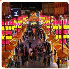
ตลาดกลางคินซาโจว