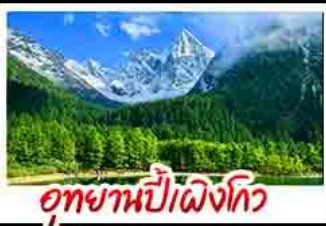
อุทยานป่าเฟิงโกว

อุทยานสัตว์ดุณี - อุทยานป่าเฟิงโกว - เมืองตูเจียงชงหนาน - รูปปั้นแม่พิมพ์ดินเผาอันเช่ซีฟี่ ร้านหนังสือจุงชู่เก้อ - ล่องเรือชมเขาวงฟอตเล่อซาน - ถนนโบราณเซอชวงกวางชอยแคบ - วัดต้าซือ ถนนคนเดินชุนชี่วู้ - แม่พิมพ์ดินเผาโบราณ - ถนนหนังกู่เฉี - ชมแสงสีน้ำพุไมไฟติก สเป - ชมตึกเฟอเจิงตุ